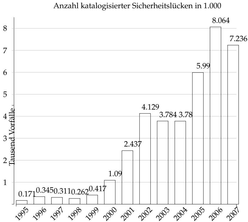
Abbildung 1: Beim CERT/CC katalogisierte Sicherheitslücken